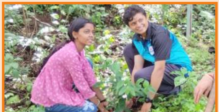
NSS Tree Plantation