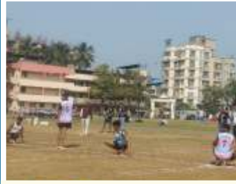
खो - खो स्पर्धा २०२५