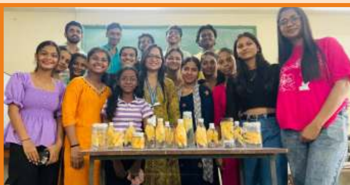
Wet Preservation Technique