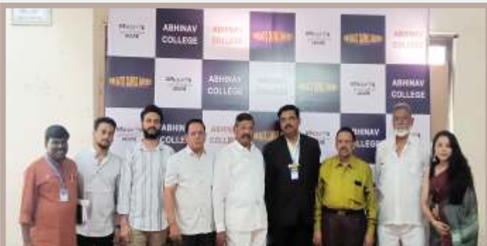
Computer and Media III vibes! Group snapshot of Guests and faculties shining together at the Cinematic Canvas Awards partnership with Reel2Reel Production House.