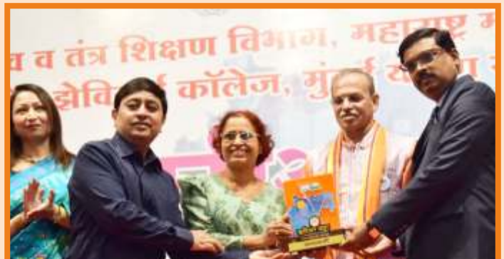
Best Career Katta Unit Award 2025-26