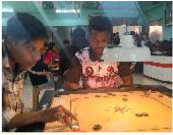
कॅरम बोर्ड स्पर्धा - २०२५