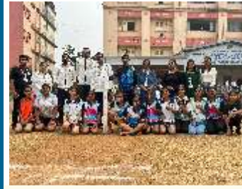
क्रिडा स्पर्धा - २०२५