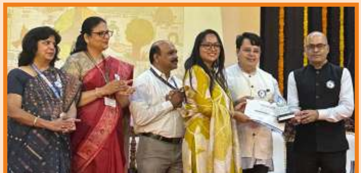
Awarded for outstanding work as Green club faculty coordinator in thane district