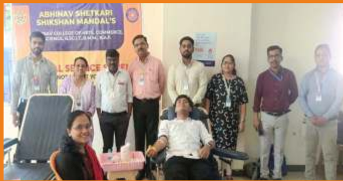
NSS Blood Donation Camp