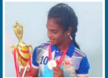
अखिल भारतीय कबड्डी स्पर्धेत निवड संजना भाईर