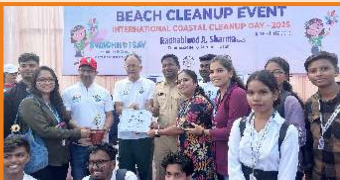
Green Club Beach Clean Up