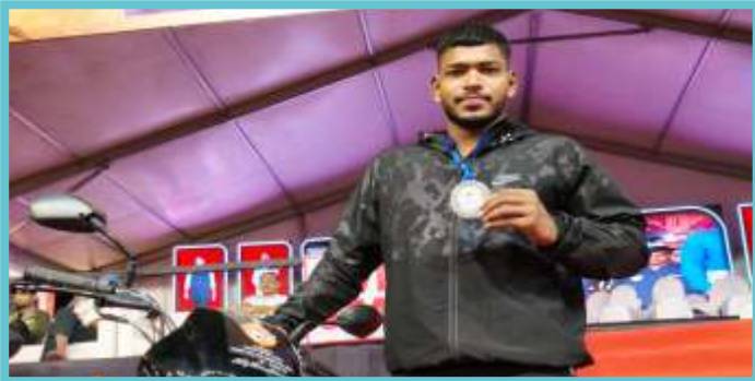
MAHARASHTRA KESARI 2026