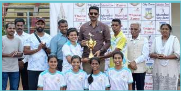
ATHLETICS CHAMPION TROPHY