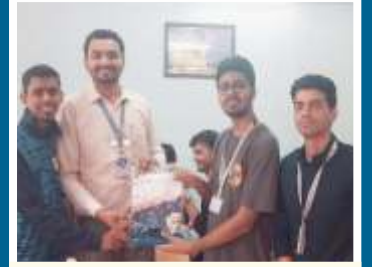
बक्षीस वितरण - २०२५