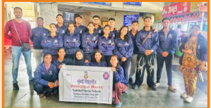
NSS Adventure Camp