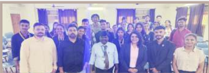
Lights, camera, VFX magic! Students & mentors strike a pose after the Visual Effects workshop at Abhinav College