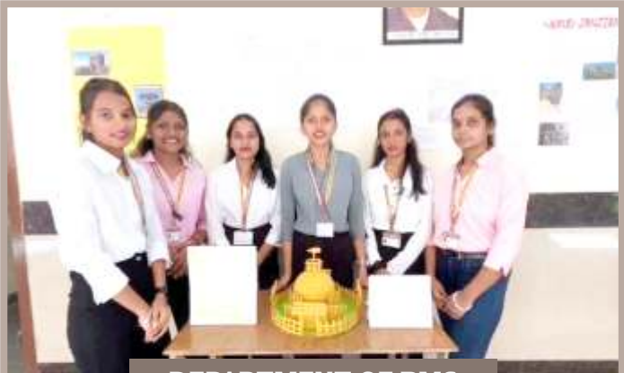
DEPARTMENT OF BMS