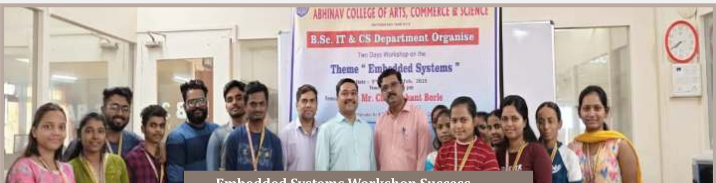
Embedded Systems Workshop Success