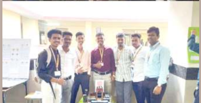
Gates to Glory Exploring India's Legendary Forts